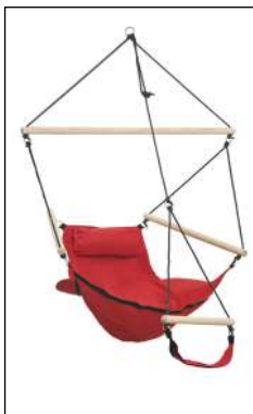
Red • AZ-2030520 EAN 4030454000857