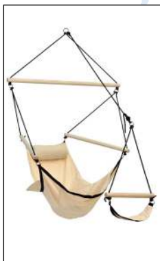
Sand • AZ-2030560 EAN 4030454000871