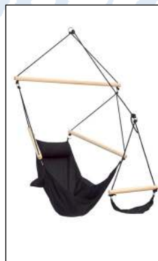
Black • AZ-2030580 EAN 4030454000505